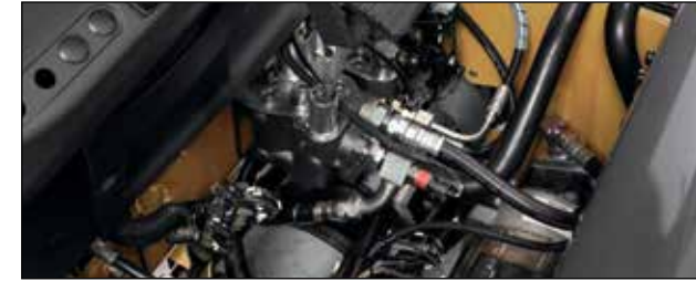
Garantía de fábrica para protección adicional