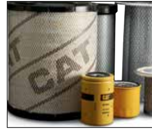
Refacciones genuinas OEM