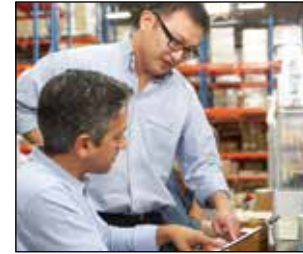
Paquetes de financiamiento habituales